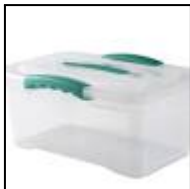
(imagen de referencia)

CAJA DE ARTE : caja de plástico de 6 lts con tapa para sus materiales (queda en sala, tamaño similar a una caja de zapatos)