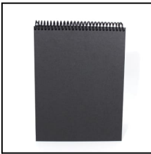
(imagen de referencia)