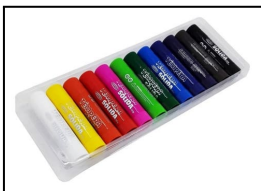
(imagen de referencia)