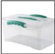
(imagen de referencia)

CAJA DE ARTE : caja de plástico de 6 lts con tapa para sus materiales ( queda en sala, tamaño similar a una caja de zapatos)